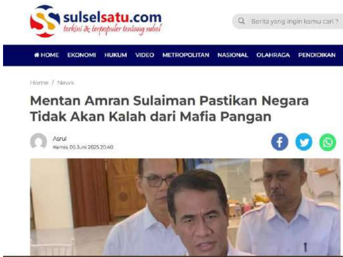
Gambar 2. Mentan Amran Sulaiman pastikan negara tidak akan kalah dari mafia pangan

Dalam menjalankan tugas, ketegasan perlu diterapkan baik kepada internal maupun eksternal. Pada periode 2014–2019, Menteri Pertanian mencopot pejabat eselon I dan II, serta merotasi pegawai yang tidak sejalan dengan prinsip kerja bersih dan profesional. Kepada pihak luar juga menegaskan bahwa tidak akan tinggal diam jika ada mafia yang mencoba bermain di sektor pertanian. Negara tidak boleh kalah. Negara harus hadir untuk membela rakyat, terutama petani yang setiap hari bekerja memastikan pangan tersedia bagi seluruh bangsa.