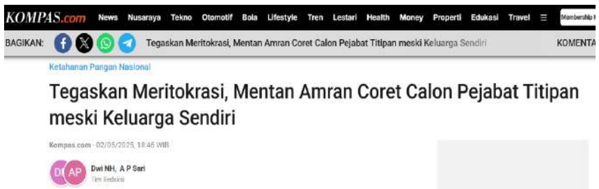
Gambar 6. Tegaskan meritokrasi, Mentan Amran coret calon pejabat titipan

Dalam berbagai momen rapat pimpinan, pertemuan dengan pegawai, acara Peringatan Hari Antikorupsi Sedunia (Hakordia), Menteri Pertanian mengatakan bahwa pejabat dan pegawai Kementerian Pertanian yang "main-main" dengan anggaran atau menjadi calo dalam pengadaan barang, maka akan dicopot dan dilaporkan kepada APH. Pejabat dan staf Kementerian Pertanian harus menjaga integritas dan profesionalitas, mematuhi semua aturan, dan tidak terlibat korupsi, karena tidak ada ampun atau toleransi bagi pelaku di Kementerian Pertanian.