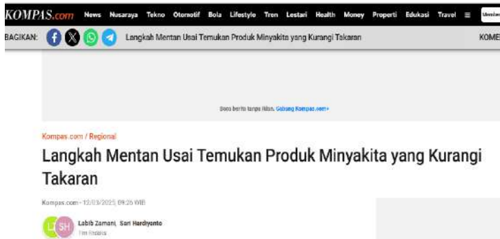
Gambar 4. Langkah Mentan usai temukan produk Minyakita yang kurang takaran