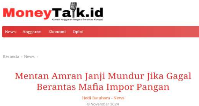
Gambar 3. Mentan Amran janji mundur jika gagal berantas mafia impor pangan

Dalam rapat dengan Komisi IV DPR di Kompleks Senayan pada Selasa, 5 November 2024, Menteri Pertanian menyampaikan pernyataan tegas yang kemudian banyak mencuri perhatian publik dan para anggota dewan. Seperti dikutip oleh MoneyTalk.id (8/11/2024), menegaskan bahwa siap mundur dari jabatan Menteri Pertanian jika gagal memberantas mafia impor pangan yang selama ini merugikan petani dan menghambat kedaulatan pangan kita.