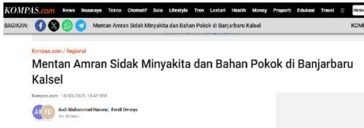
Gambar 5. Mentan Amran sidak Minyakita dan bahan pokok di Banjarbaru