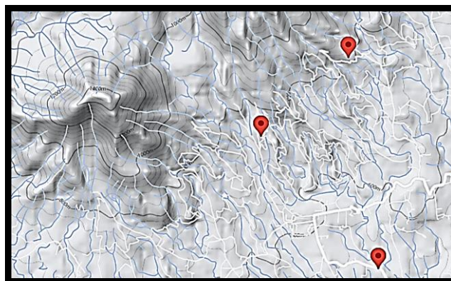
Gambar 1. Titik koordinat lokasi pengambilan contoh tanaman teh di perkebunan teh PTPN VIII, Parakan Salak, Sukabumi, Jawa Barat

Penelitian dilaksanakan di kebun PTPN VIII di Parakan Salak, Sukabumi, Jawa Barat dan Laboratorium Terpadu, Balai Penelitian Tanaman Industri dan Penyegar, Sukabumi, Jawa Barat pada bulan Maret 2018. Bahan penelitian adalah tanaman teh klon TRI berumur ±45 tahun, yang ditanam pada ketinggian 535 m dpl (6°48'19.7"S 106°43'04.6"E), 737 m dpl (6°47'11.4"S 106°42'04.2"E), dan 867 m dpl (6°46'29.1"S 106°42'49.1"E) (Gambar 1), jenis tanah Andisol.