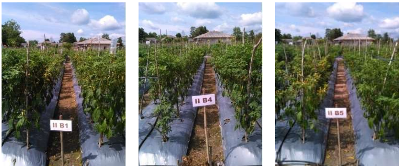
Gambar 2. Keragaan tanaman cabai rawit pada saat mulai berbuah (B1, B4, B5) pada lahan bekas tambang timah di Desa Bukit Kijang, Kecamatan Namang, Kabupaten, Bangka Tengah, Provinsi. Bangka Belitung, 2016

Keterangan: Angka yang diikuti huruf kecil yang sama pada kolom yang sama, tidak berbeda pada taraf 5% DMRT, HST = hari setelah tanam