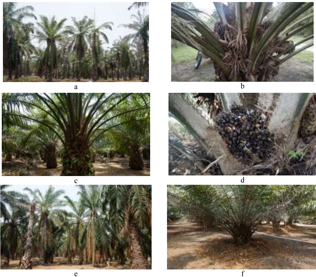
Gambar 3. Berbagai gejala stress kekeringan pada tanaman kelapa sawit: (a) Muncul lebih dari 2 daun tombak (b) Banyak muncul bunga jantan (c) Cadangan bunga dan buah kosong (d) Malformasi tandan (e) Pelepah sengkleh (f) Pelepah lingkaran terbawah mengering

hingga 41%. Namun demikian, menurut Harahap dan Latif (1998), recovery /pemulihan pada tanaman muda lebih cepat dibandingkan tanaman yang lebih tua.