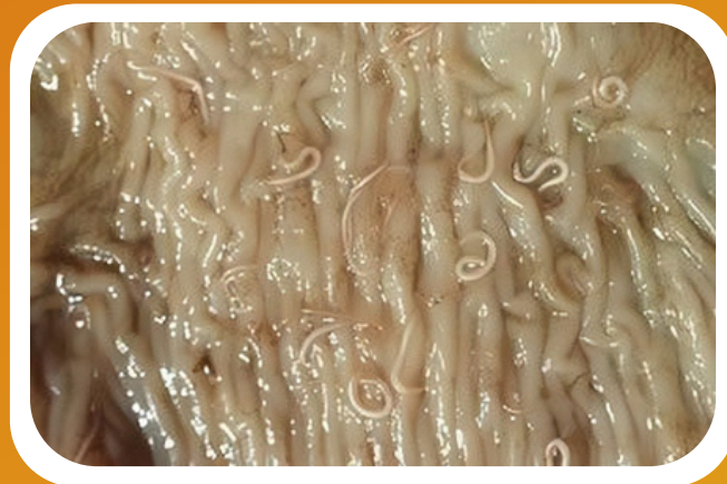
Tampak cacing Ascaris vitulorum yang tersebar pada saluran pencernaan sapi