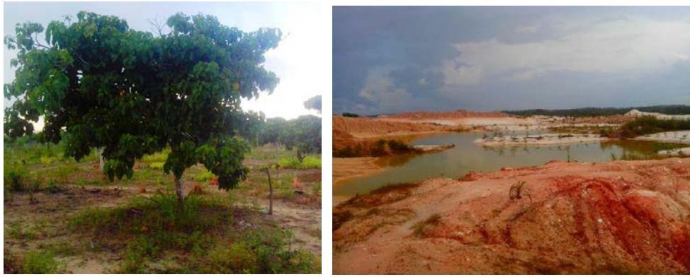
Gambar 1. Lahan pertanian sebelum ditambang (kiri) dan lahan bekas tambang (kanan) di Pulau Bangka Figure 1. Agricultural land before mining (left) and the mined land (right) in Bangka Island

(1986) di Ipoh Malaysia mendapatkan mineral dominan di dalam fraksi liat pada lahan bekas tambang adalah kaolinit, mika dan klorit yang mengindikasikan bahwa tanah tersebut tergolong tanah tua.