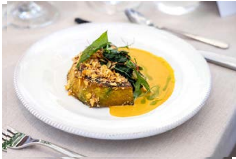
Gambar 3. Berbagai macam makanan mulai dari labu, tahu, es krim hingga pengganti daging dapat dibuat dari Solein

maksimum. Pengolahan di hilir terutama terdiri dari proses-proses yang selanjutnya dapat menjamin keamanan, kualitas teknologi, dan nutrisi dari produk akhir. Biomassa bakteri solein adalah bubuk kering yang mengandung 65-75% protein, karbohidrat, lemak, dan zat gizi mikro.