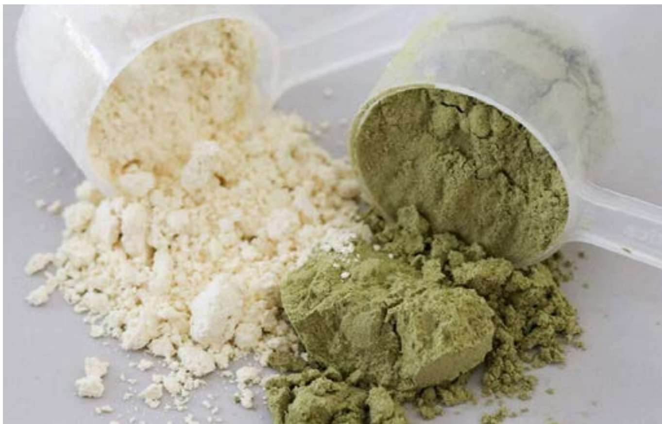
Gambar 2. Bubuk solein mengandung 50 persen protein, 20 hingga 25 persen karbohidrat, dan 5 hingga 10 persen lemak.

Budi daya dalam bioreaktor berlangsung dalam kondisi yang optimal dan terkendali untuk menjamin efisiensi dan keamanan pertumbuhan