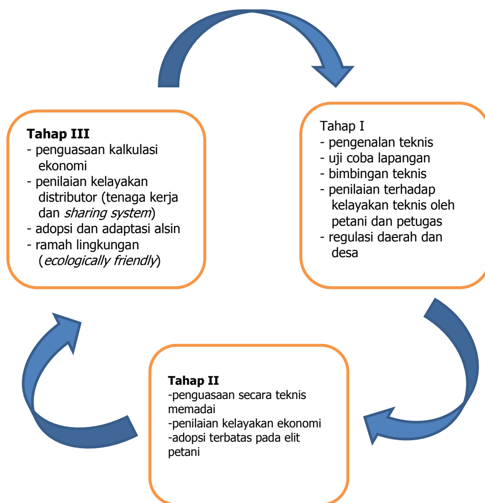
Gambar 1. Tahap Perkembangan Adopsi Alsin Pertanian pada Kegiatan Pertanian Padi Sawah (Mayrowani et al. , 2009)

Secara umum dapat dikatakan bahwa saat ini sistem pertanian padi sawah di perdesaan, yang sebagian besar merupakan usahatani keluarga, sedang dalam era transisi dan di persimpangan jalan yaitu apakah akan mampu menjadi tulang punggung kehidupan ekonomi desa atau akan menjadi beban kehidupan ekonomi desa. Dari kasus perkembangan penggunaan alsin pertanian di Jawa Tengah dan Sulawesi Selatan dapat digambarkan tentang evolusi dan perkembangan UPJA (Gambar 1). Proses evolusi dan perkembangan UPJA dapat dipandang sebagai proses siklikal. Dari satu siklus proses evolusi ke siklus yang berikutnya tidak berlangsung statis, tetapi dinamis, yaitu melalui proses penyesuaian atau adaptasi (teknis, ekonomi, ketenagakerjaan dan distributif).